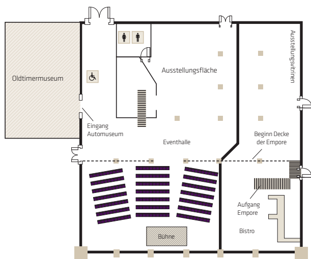
Reihenbestuhlung für 210 Personen

Parlamentarische Bestuhlung: 30 – 150 Personen